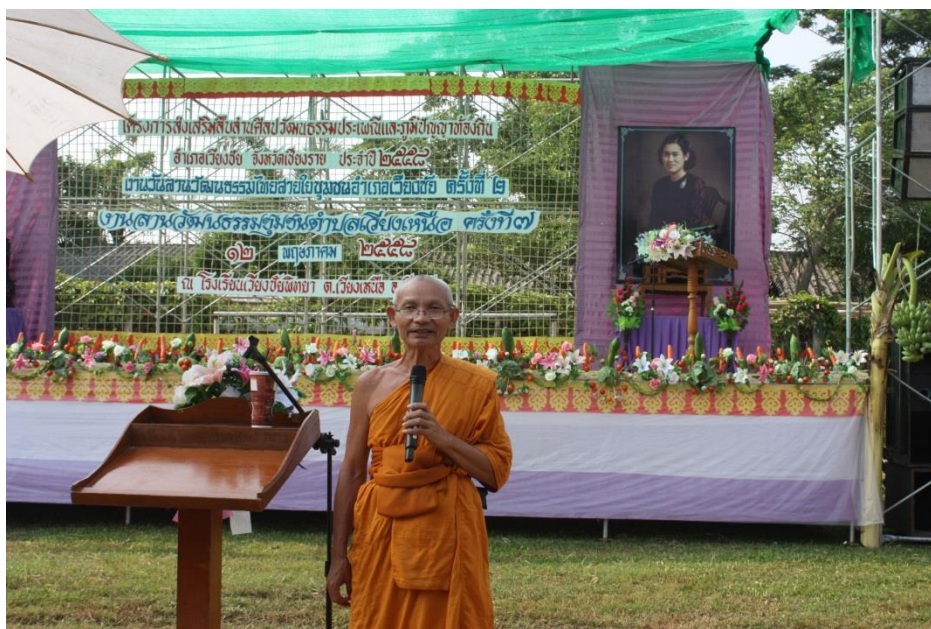
ทำหน้าที่พิธีกร/พิธีการ

ภาคการศึกษาที่ ๒ ปีการศึกษา ๒๕๕๗ วันที่ ๑๒ พฤษภาคม ๒๕๕๘ ได้ส่งเสริม ประเพณีและภูมิปัญญาท้องถิ่นอำเภอเวียงชัย และงานลานวัฒนธรรมชุมชนตำบลเวียงเหนือ ครั้งที่ ๗ ในฐานะที่ปรึกษาคณะกรรมการจัดงานโครงการส่งเสริมสืบสานวัฒนธรรมประเพณีและภูมิปัญญา ท้องถิ่นอำเภอเวียงชัย ประจำปี ๒๕๕๘ ณ โรงเรียนเวียงชัยพิทยาศาสตร์ (พระปริยัติธรรม แผนกสามัญ ศึกษา) อำเภอเวียงชัย ตั้งแต่เวลา ๐๘.๓๐-๑๖.๓๐ น. โดยทำหน้าที่พิธีกร และบรรยายพิเศษเรื่อง วัฒนธรรมท้องถิ่น