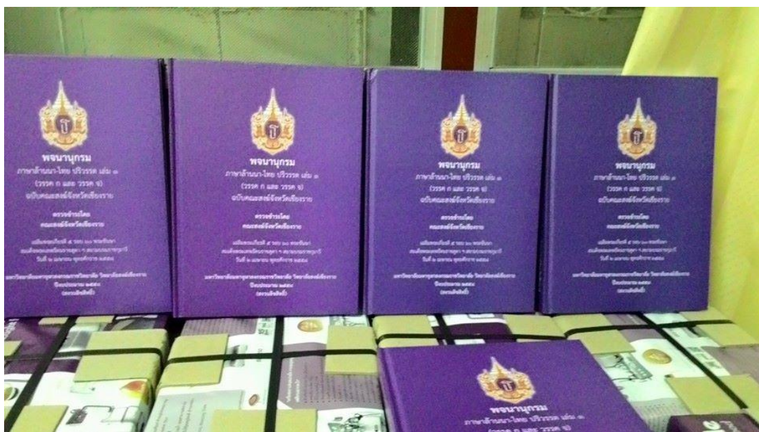
หนังสือพจนานุกรมภาษาล้านนา/ไทย ปรีวรรต เล่ม ๑

๖๐ พระชันษา สมเด็จพระเทพรัตนราชสุดาฯ สยามบรมราชกุมารี วันที่ ๒ เมษายน ๒๕๕๘ เป็นการส่งเสริมทำนุบำรุงพระพุทธศาสนาและศิลปวัฒนธรรมระดับชาติ ซึ่งเป็นเอกสารประเภทอ้างอิง