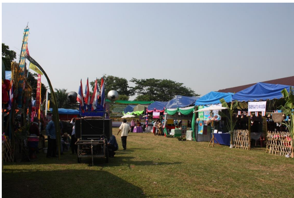
เต็นท์แสดงนิทรรศการศิลปวัฒนธรรมของแต่ละหมู่บ้านในอำเภอเวียงชัย