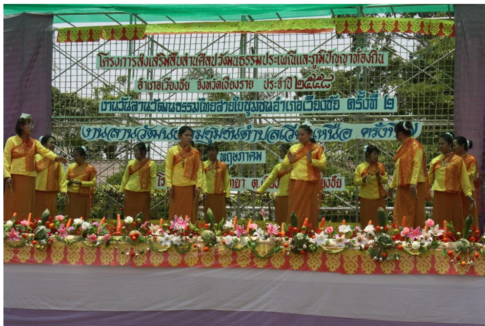
การแสดงศิลปวัฒนธรรมของหมู่บ้านต่าง ๆ บนเวที